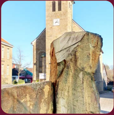
TITELFOTO: NE „DER BLANKE STEIN“